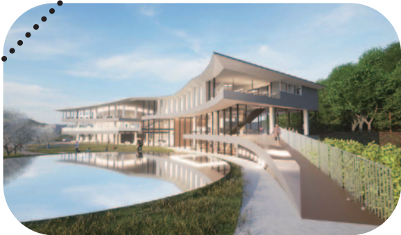
キャンパスイメージ