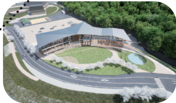
キャンパスイメージ