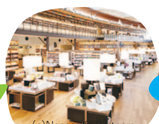
武雄市図書館・歴史資料館